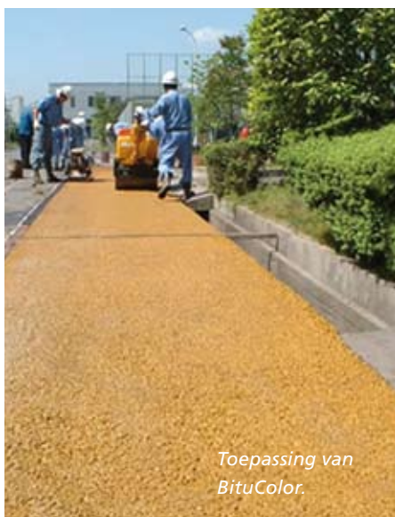
Toepassing van BituColor.