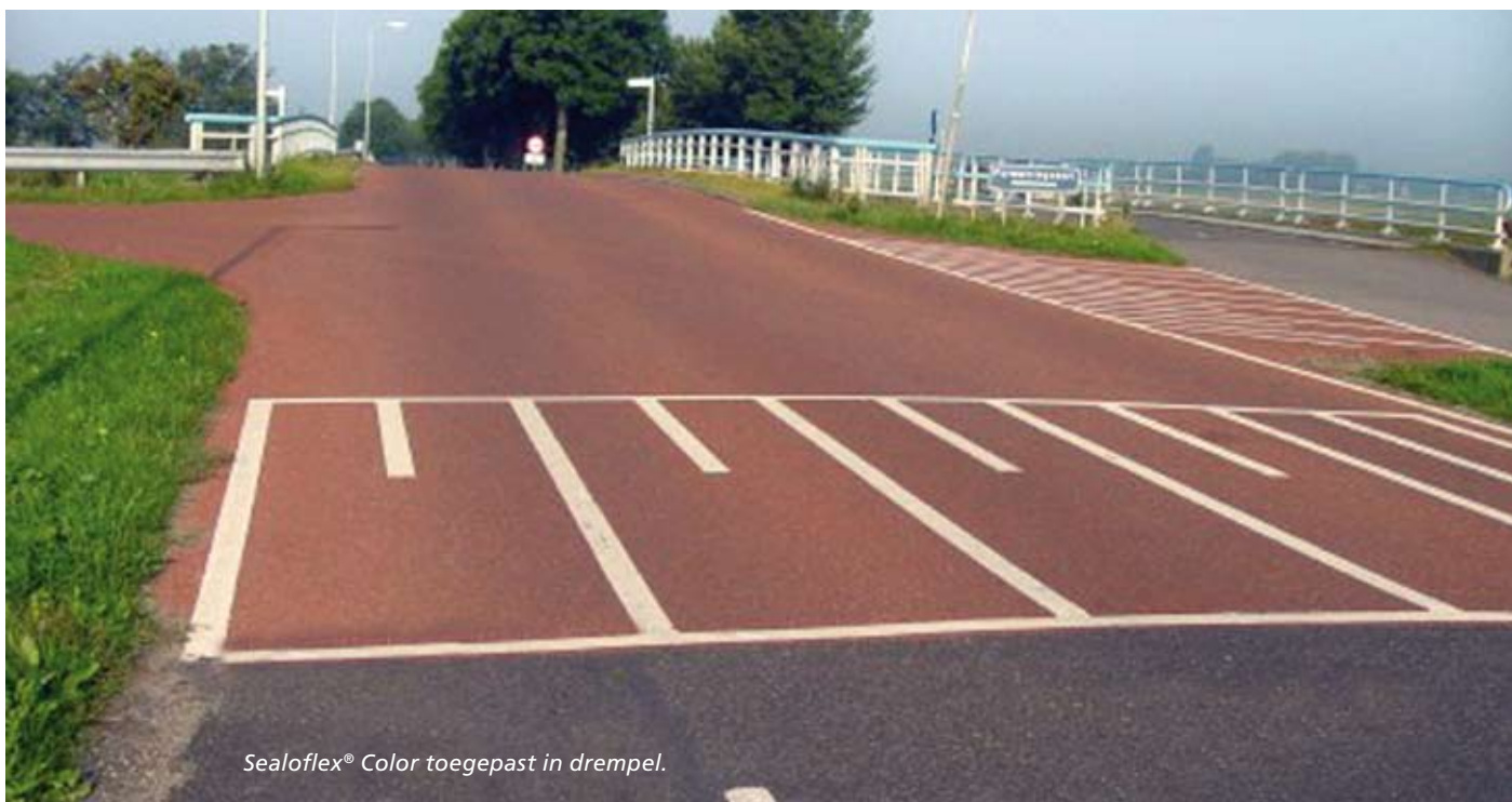
Sealoflex® Color toegepast in drempel.